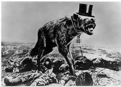
ERIEG UND LEICHEN – DIE LETZTE HOFFNUNG DER REICHEN >Krieg und Leichen, die letzte Hoffnung der Reichen< 1932 John Hearthfield