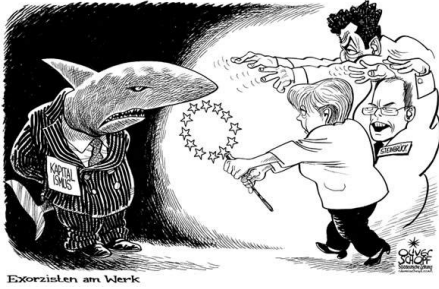
Grafik: Oliver Schopf / Wien

Die Reden zum Tag der deutschen Einheit waren trunken vom Bekenntnis zu Europa. Aber die Spardiktate, Schuldenbremsen und der Abbau des Sozialstaats - die aus der Krise führen sollen - verraten das Diktat des Kapitals, vor dem die politisch Verantwortlichen kapitulieren. Erst die Immobilienkrise, dann die Bankenkrise, jetzt die Schuldenkrise mehrerer Staaten - wie konnte es dazu kommen? Wohin treibt Europa? Wird die wiederholte Rettung der Banken dem Anspruch der Menschen auf Freiheit und Gleichheit gerecht? Wie kann ein Leben für alle gelingen - jenseits des entfesselten Finanzkapitalismus?