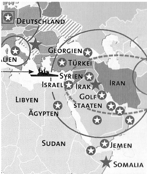
Grafik: Atlas der Globalisierung

Bomben auf den Iran? Das ist keine offene Frage mehr. Offen ist nur noch: Wann? Wer?